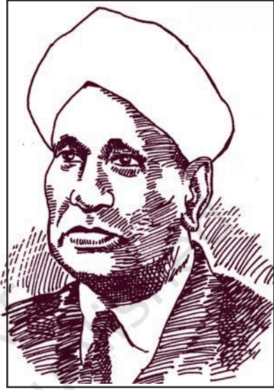
सर चंद्रशेखर वेंकट रामन्

रामन् का मस्तिष्क विज्ञान के रहस्यों को सुलझाने के लिए बचपन से ही बेचैन रहता था। अपने कॉलेज के जमाने से ही उन्होंने शोधकार्यों में दिलचस्पी लेना शुरू कर दिया था। उनका पहला शोधपत्र फिलॉसॉफिकल मैगज़ीन में प्रकाशित हुआ था। उनकी दिली इच्छा तो यही थी कि वे अपना सारा जीवन शोधकार्यों को ही समर्पित कर दें, मगर उन दिनों शोधकार्य को पूरे समय के कैरियर के रूप में अपनाने की कोई खास व्यवस्था नहीं थी। प्रतिभावान छात्र सरकारी नौकरी की ओर आकर्षित होते थे। रामन् भी अपने समय के अन्य सुयोग्य छात्रों की भाँति भारत सरकार के वित्त-विभाग में अफ़सर बन गए। उनकी तैनाती कलकत्ता* में हुई।